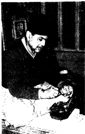
मल्ले पान ल लेया जाय तर मस कारम का भानद ह